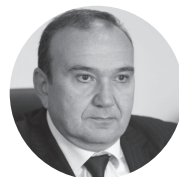
Լևոն Սկրոյան, ՀՀ կրթության և գիտության Նախարար