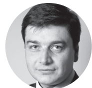
Դավիթ Սահակյան, ՀՀ կրթության և գիտության Նախարարի տեղակալ