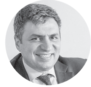
Դավիթ Փախչանյան, ՀՀ պաշտպանության փոխնախարար, «Այբ» կրթական հիմնադրամի հոգաբարձուների խորհրդի նախագահ